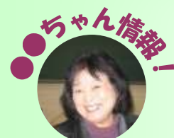
ビジネスサポーター Tさん